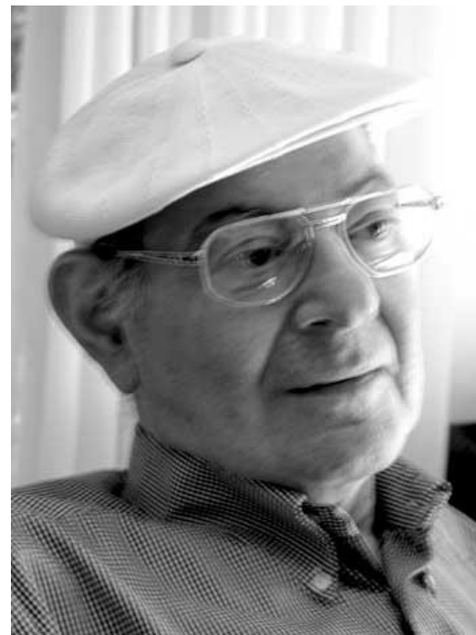
Mauricio Kagel

Contact / Kontakt : Sophie Schricker Coordinatrice du fonds franco-allemand pour la musique contemporaine/ Leiterin Impuls neue Musik sophie.s@french-music.org +49 (0)30 885 902 44