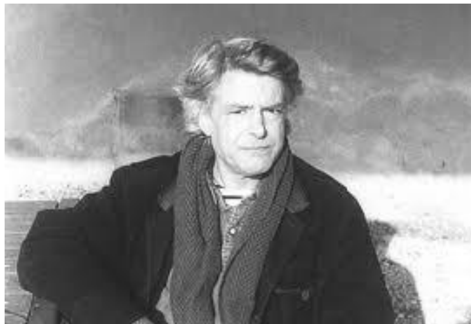
Georges Aperghis

Plus de détails sur : www.kunststiftungnrw.de Contact pour la presse : Vera Firmbach, Cologne/ Tél.+49- (0)221-7327970/ Mobile:+49- (0)179-2400866 verafirmbach@gmx.net